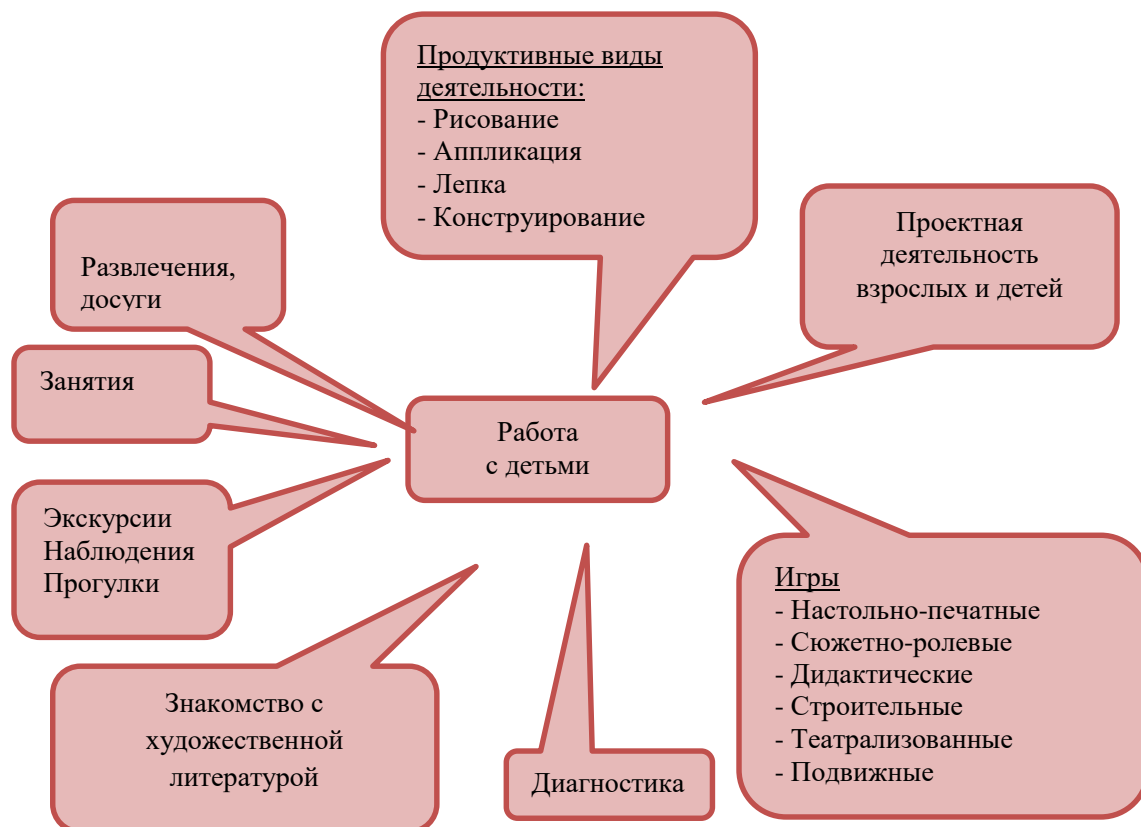
Рис.1 Формы работы с детьми по обучению безопасному поведению на дороге

Работа в ходе реализации программы может быть специально организована, а также внедрена в обычные плановые формы работы.